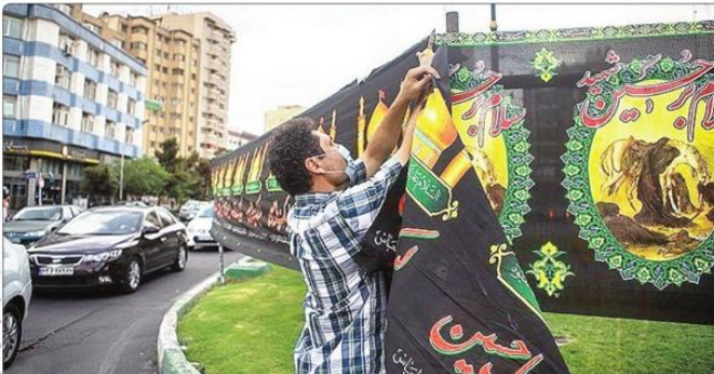
سیاه آذین کردن معابر و خیابان های پایتخت در آغاز ماه محرم

اوایل پرایس: چین، روسیه، ترکیه، ونزوئلا و افغانستان بسیار مشتاق خرید نفت ایران هستند