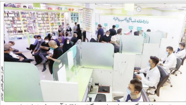
وزیر بهداشت: کمبودهای دارویی کشور تا ۳ ماه آینده رفع خواهد شد

رئیس سازمان محیط زیست، استخراج آب‌های ژرف موجب برهم‌خوردن تعادل منابع آب و زیان به طبیعت می‌شود مطالعه و اکتشاف آب‌های ژرف در سیستان و بلوچستان ممنوع داشته است برای تأمین منابع آبی همچنان باید متکی به روان‌آب‌ها و طرح‌های انتقال بود باز چرخش آب و تصفیه فاضلاب بهترین شیوه تأمین آب برای بخش‌های صنعتی است هیچ طرح عمرانی بدون مجوز محیط زیست شروع نمی‌شود پروژه انتقال آب از دریای خزر به فلات مرکزی از دستور کار دولت خارج شد بررسی رئیس محیط زیست اجرای فاز دوم طرح انتقال آب دریای عمان به کویر مرکزی آغاز شد دامنه‌های زاگرس دیگر توان دیدگاری ندارند و باید برای مردم منطقه معیشت جایگزین تعریف کنیم استخراج آب‌های ژرف بدون رئیس جمهوری و رئیس سازمان مطالعات زیست محیطی موجب اختلال محیط زیست در گفتگوی برهم خوردن تعادل منابع آب و اختصاصی یا خریدار اطلاعات زیان به طبیعت خواهد شد. ضمن اعلام این مطلب افزود: علمی، سلسله معساران ۲ صفحه