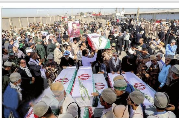
ورود پیکرهای مطهر ۳۵ شهید تازه تفحص شده با استقبال عشایر قشقایی از مرز سلمچه

گوتش از برجام به عنوان بهترین گزینه برای حل و فصل موضوع هسته‌ای ایران و دیپلماسی چند جانبه یاد کرد و از ایران و آمریکا خواست برای حل و فصل موضوعات باقیمانده در مسیر احیای برجام، نرمش بیشتری نشان دهند