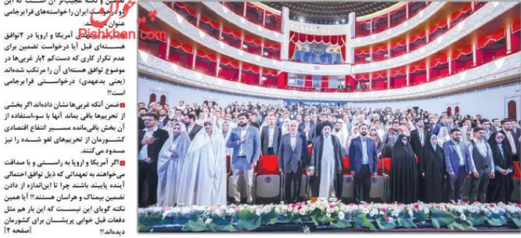
آیین گرامیداشت هفته از دواج در مجلس شورای اسلامی

آمریکا با انتفاع اقتصادی ایران به شدت مخالفت می‌ورزد آیت‌الله رئیسی در آیین گرامیداشت هفته از دواج: بانک مرکزی ظرف ۱۵ روز آیین‌نامه تسریع و تسهیل در وام از دواج را تهیه کند