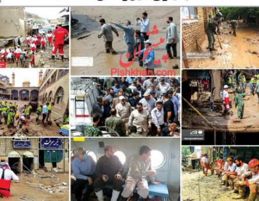
۱۰ | صفحه

چهارم نظر می‌رسد که صنعت نفت ایران به‌رغم تحریم‌های آمریکا به‌سوزد در بخش انرژی هر روز قوی‌تر می‌شود. هروپترز با اشاره به نقش جدید بازار نفت چین پس از جنگ لوکراین: «صادرات نفت ایران به مقصد چین با رشد ۱۴ درصدی همراه بوده است و بیشترین جهش را نسبت به نفت سایر کشورها داشته است.»