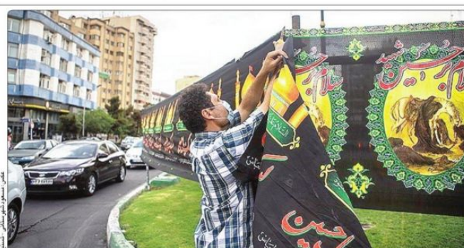
سیاه آذین کردن معابر و خیابان‌های پایتخت در آغاز ماه محرم

اوایل پرایس: چین، روسیه، ترکیه، ونزوئلا و افغانستان بسیار مشتاق خرید نفت ایران هستند