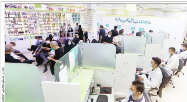
وزیر بهداشت: کمبودهای دارویی کشور تا ۳ ماه آینده رفع خواهد شد

رئیس سازمان محیط زیست، استخراج آب‌های ژرف موجب برهم خوردن تعادل منابع آب و زیان به طبیعت می‌شود.