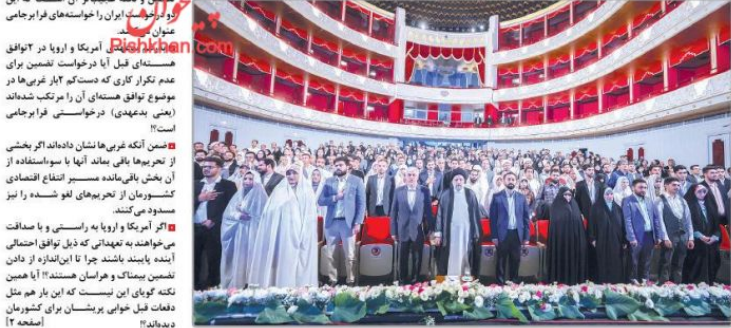
آیین گرامیداشت هفته از دواج در آیت‌الله رئیسی در آیین گرامیداشت هفته از دواج: بانک مرکزی ظرف ۱۵ روز آیین‌نامه تسریع و تسهیل در وام از دواج را تهیه کند

آیت‌الله رئیسی در آیین گرامیداشت هفته از دواج: بانک مرکزی ظرف ۱۵ روز آیین‌نامه تسریع و تسهیل در وام از دواج را تهیه کند